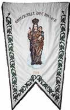
Els Goigs del Roser

Caramelles del Roser Sant Julià de Vilatorça